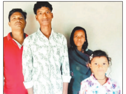
घरघोड़ा के रूमकेरा का मामला, पीड़ित परिवार ने एसडीएम से लगाई न्याय की गुहार

जिले के घरघोड़ा के ग्राम पंचायत रूमकेरा के सरपंच द्वारा तानाशाही रवैया अपनाते हुए एक परिवार का सामाजिक बहिष्कार कर उनका हुक्कापानी बंद कर दिया गया है। स्थानीय स्तर पर मुनादी करवा दी गई कि यदि गांव का कोई भी व्यक्ति इस परिवार से संपर्क रखेगा या बात करेगा तो उसके ऊपर 10 हजार रुपए का जुर्माना लगाया जाएगा। इसके चलते गांव के सभी लोग परिवार से पूरी तरह से कट गए हैं, जिससे वे गहरे मानसिक और आर्थिक संकट में आ गए हैं। पीड़ित परिवार द्वारा मामले की शिकायत एसडीएम से करते हुए न्याय की गुहार लगाई गई है।