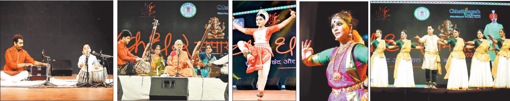
हरिभूमि न्यूज | रायगढ़

अंतरराष्ट्रीय ख्याति प्राप्त चक्रधर समारोह के 40वें वर्ष का छठा दिन शास्त्रीय संगीत और नृत्य की मनमोहक प्रस्तुतियों से सराबोर रहा। रायगढ़ की सांस्कृतिक धरोहर को जीवंत करती प्रस्तुतियों ने जहां परंपरा और आधुनिकता का संगम दिखाया, वहीं कलाकारों की नृत्य-भावभंगिमाएं और सुर-लहरियां देर रात तक श्रोताओं को मंत्रमुग्ध करती रहीं। कार्यक्रम का शुभारंभ स्थानीय कलाकारों ने किया।